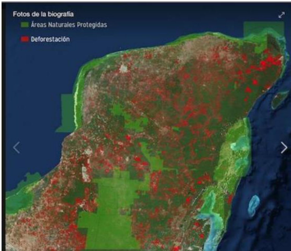
Imagen 1. Mapa de cambio 2001-2016

Hay otro efecto muy importante que es de todas las especies migratorias de aves del continente americano pasan por México y más de la mitad de ellas pasa por Yucatán, esto es muy importante tenerlo en cuenta. Si hacemos una afectación por muy pequeña que sea a la flora, que hoy de manera directa estamos afectando también a la fauna, y estas son aves, estas vuelan. ¿Qué podemos decir de la fauna terrestre? Eso hay que tenerlo en cuenta.