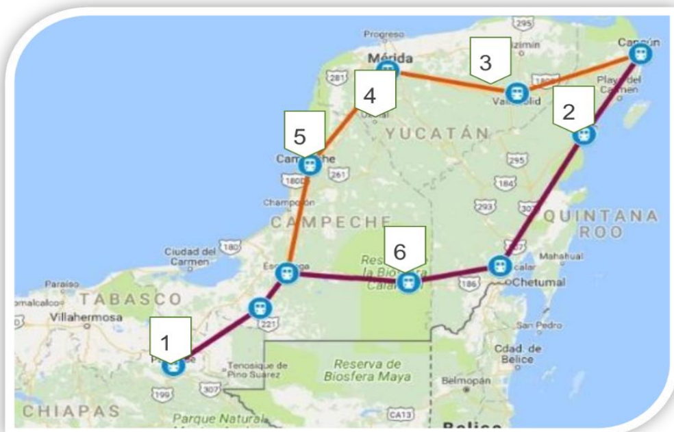
Imagen 1. Sitios arqueológicos

La Lista del Patrimonio Mundial de la UNESCO es un legado de monumentos y sitios de una gran riqueza natural y cultural que pertenece a toda la humanidad. Los Sitios inscritos en la Lista de Patrimonio Mundial cumplen una función de hitos en el planeta, de símbolos de la toma de conciencia de los Estados y de los pueblos acerca del sentido de esos lugares y emblemas de su apego a la propiedad colectiva, así como de la transmisión de ese patrimonio a las generaciones futuras. México, ocupa el sexto lugar de la lista de países con mayor número de reconocimientos de esta índole. Nuestro País cuenta con 33 lugares reconocidos como Patrimonio Cultural de la Humanidad, de los cuales 6 se encuentran en el sur-sureste de nuestro país.