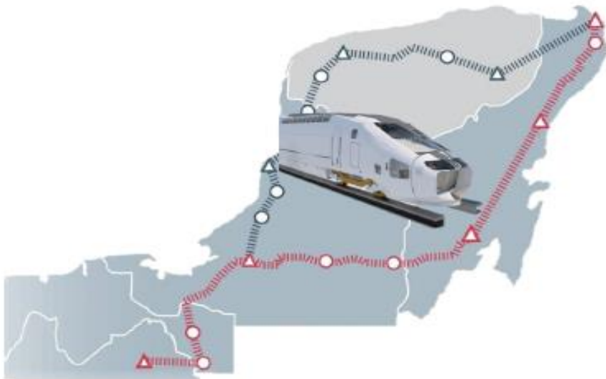
Imagen 1. Circuito ferroviario

Circuito Ferroviario de 1,525 kilómetros